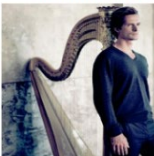
Xavier DE MAISTRE